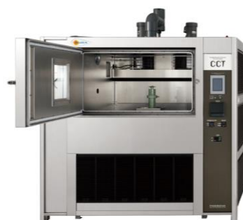
腐食試験機 複合サイクル試験機 CCT-1L