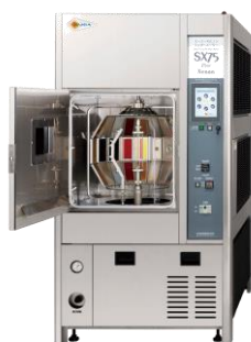
耐候性試験機 スーパーキセノンウェザーメーター SX75

設置する試験機は、日系メーカー向けの実績が豊富なスガ試験機株式会社（東京都新宿区）製で、幅広い試験需要に対応が可能となる高機能な機種とし、様々なニーズに効率よく応えることができます。