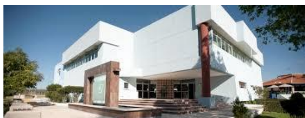
C I D E T E Q

C I D E T E Qは、メキシコに27ある公立研究所の1つで、メキシコ国家科学技術審議会によって運営されている試験機関であり、腐食試験・耐候性試験に関する豊富な経験を持っています。同国内における自動車産業の中心地であるケタロ州に位置する同社内に試験機を設置し、受託試験を実施いたします。