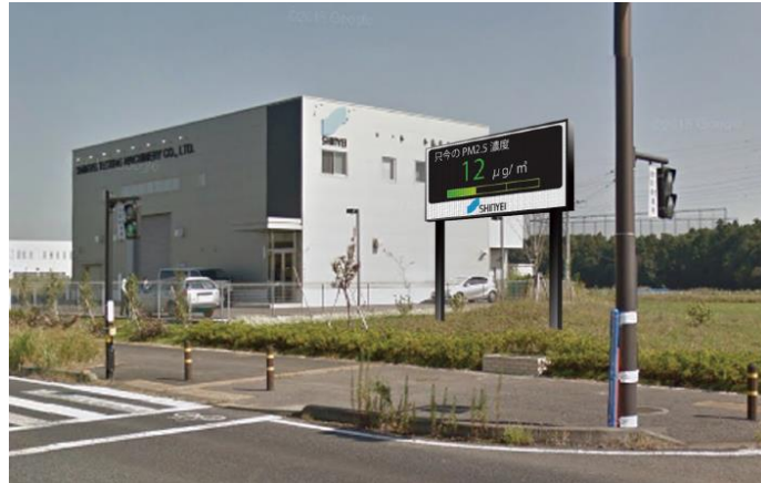
神栄テストマシナリー株式会社 本社（設置イメージ）